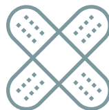
Los vendajes en EB sirven para fijar los apósitos en el lugar indicado