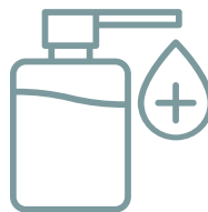
Productos recomendados para el baño: geles o aceites hidratantes para pieles sensibles y/o atópicas

*Si el bebé ha nacido con lesiones amplias, heridas infectadas o más sensibles al dolor, realizaréis la cura por partes o protegeréis las heridas más delicadas durante el baño.