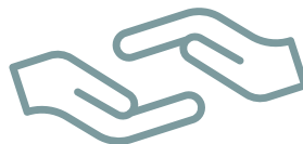
Los cuidados diarios de vuestro bebé serán los propios del recién nacido

Si algún apartado ya lo conocéis bien, sentiros orgullosos de vuestro progreso y pasad al siguiente.